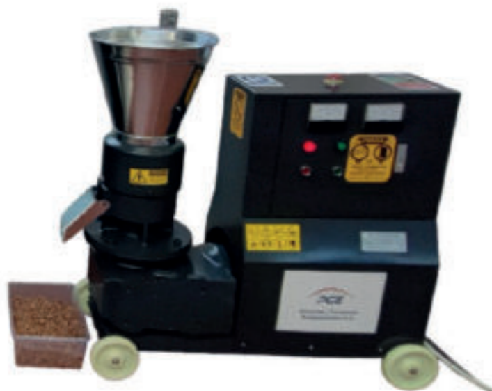
Urządzenie do peletowania biomasy

Biomasa jest wyjątkowo uniwersalnym substratem energetycznym wykorzystywanym nie tylko do celów grzewczych, ale również do produkcji energii elektrycznej oraz paliw transportowych. „Wydajna, a przede wszystkim zrównoważona produkcja energii wymaga stosowania paliw o odpowiednich właściwościach. Proces peletyzacji biomasy zapewni nie tylko większą gęstość energii wytworzone