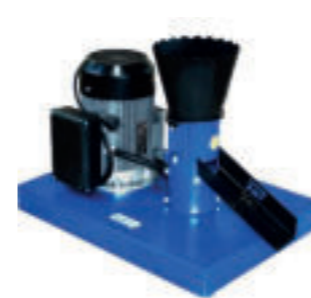
KGM-100 / 1.5 KW