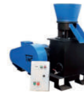
PRIME-300 / 30 KW