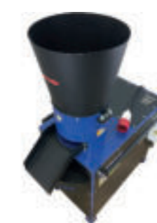
GMK-260 / 11 KW