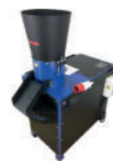
GMK-200 / 7.5 KW