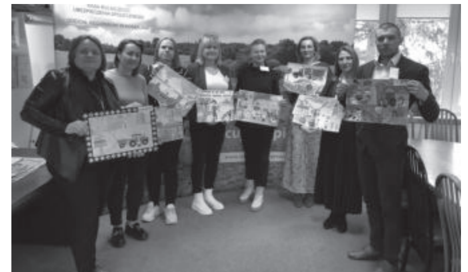
Komisja Konkursowa z nagrodzonymi pracami plastycznymi

Prace plastyczne sześciorga laureatów, jak również rymowanki, które zajęły trzy pierwsze miejsca w etapie wojewódzkim będą reprezentować nasze województwo w etapie centralnym konkursów. Ogłoszenie wyników i wręczenie nagród nastąpi przed zakończeniem roku szkolnego 2022/2023. Lista