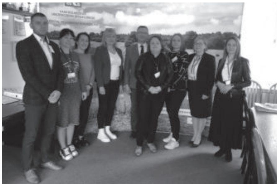
Komisja Wojewódzka Konkursu dla Dzieci na Rymowankę