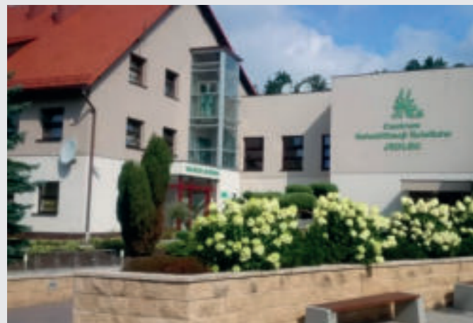
Centrum Rehabilitacji Rolników w Jedlcu