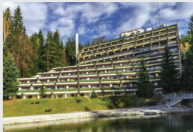
Centrum Rehabilitacji Rolników „Granit” w Szklarskiej Porębie