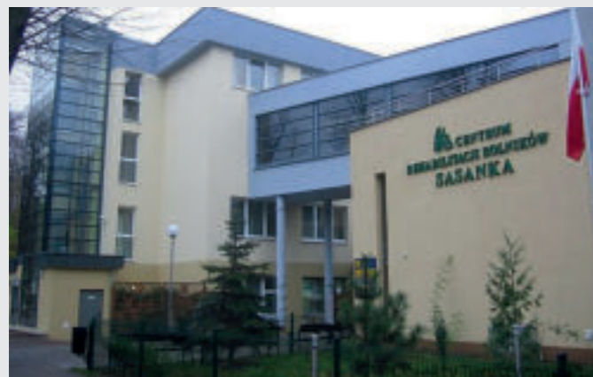
Centrum Rehabilitacji Rolników „Sasanka” w Świnoujściu

Turnusy rehabilitacyjne organizowane przez Kasę Rolniczego Ubezpieczenia Społecznego Oddział Regionalny w Koszalinie realizowane są przez cały rok, w czterech Centrach Rehabilitacji Rolników: