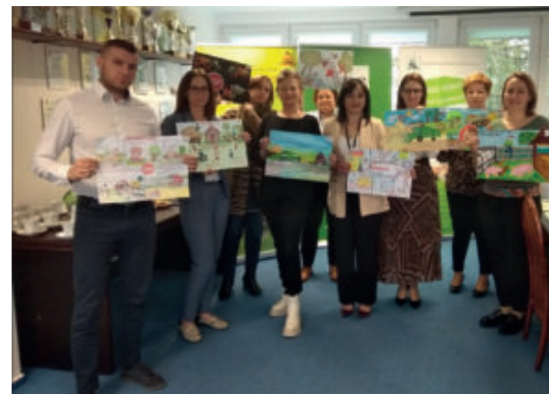
Komisja Konkursowa z nagrodzonymi pracami plastycznymi

Zabronione jest kierowanie ciągnikami rolniczymi i obsługiwaniem maszyn rolniczych oraz przebywanie w strefie pracy maszyn i pojazdów rolniczych. Nie wolno angażować dzieci do pomocy przy sprzęganiu oraz pozwalać im na przebywanie pomiędzy ciągnikiem a sprzęganą maszyną. Niebezpieczne dla dzieci są prace związane z obsługą maszyn stacjonarnych, zwłaszcza: siewczarni, śrutowników, gniotowników, mieszalników, rozdrabniaczy, dmuchaw, przenośników ślimakowych i taśmowych. Niedopuszczalne jest przebywanie osób na pomostach załadunkowych siewników i sadzarek do ziemniaków w trakcie pracy tych maszyn. Dzieciom nie wolno uczestniczyć w przeryźnianiu drewna pilarką tarczową, (tzw. krajegą lub cyrkularką) – jedną z najniebezpieczniejszych maszyn w gospodarstwie. Nie mogą wykonywać prac związanych ze ścinaniem i ściąganiem drzew zawieszonych