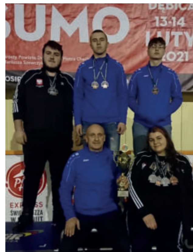
Na zdjęciu od lewej: